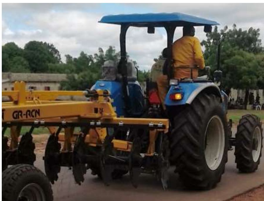
COLUFIFAs nye traktor