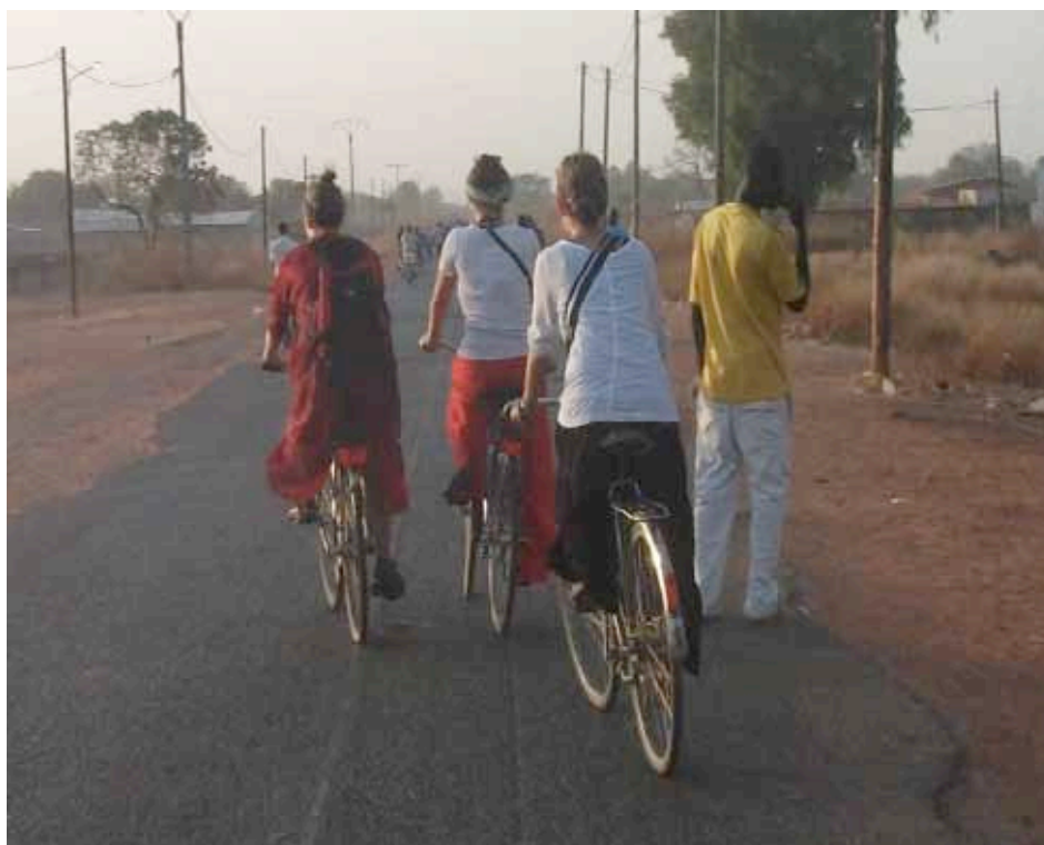
Rysensteen cykler i Senegal.